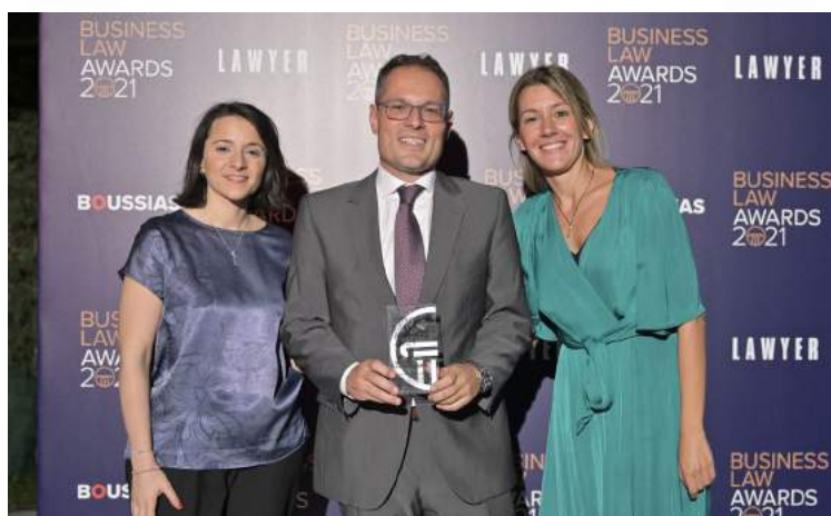
Watson Farley & Williams